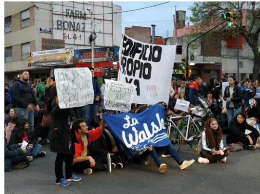
Marcha "Aulas Ya" - 2019

La ampliación en la oferta educativa y el sostenimiento de la formación pública y gratuita vienen acompañados de esfuerzos y de luchas de la comunidad educativa para alcanzar las condiciones materiales que habilitan la formación de técnicos y docentes en clave de más calidad y más derechos. Un largo camino de solicitudes, asambleas, marchas y movilizaciones nos traído hasta este año, un año de festejo por el avance en la posibilidad de un espacio propio.