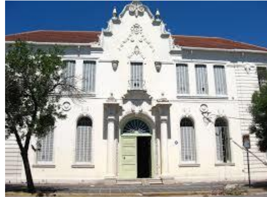
Fachada de la sede del ISP 8

La celebración constituye un momento oportuno para destacar el lugar del Instituto Superior del Profesorado “Almirante Guillermo Brown” en la sociedad y la educación santafesina. Nuestra presencia es más incipiente en el tiempo, poco más de medio siglo, 52 años. Un tiempo más corto, pero no por ello menos productivo. En este recorrido el Instituto fue creciendo desde ser un centro de “formación de maestros” hasta lo que es hoy un Instituto Superior que congrega 11 carreras terciarias y una Escuela Preparatoria de Idiomas, en dos sedes y tres turnos de cursado, y que reúne a estudiantes de los barrios de Santa Fe, de otras ciudades de la provincia, e incluso de provincias vecinas.