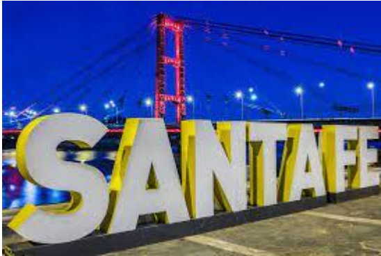
Costanera de Santa Fe

Lejos estamos hoy de ese origen, nuestra ciudad es muy distinta de la fundada por Juan de Garay a las orillas del río de los Quiloazas, en tierra de Calchines y Mocoetás, el 15 de noviembre de 1573. El emplazamiento urbano, la sociedad, las instituciones, las creencias constituyen un nuevo escenario - más laico, por cierto -. A las puertas del siglo XXI, hoy nos interpelamos como actores partícipes de una institución educativa.