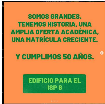
Campaña en las redes - 2021