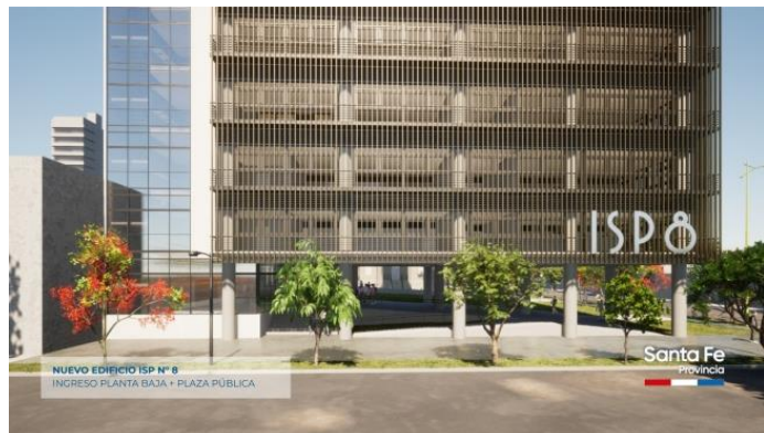
Proyecto del edificio de uso exclusivo